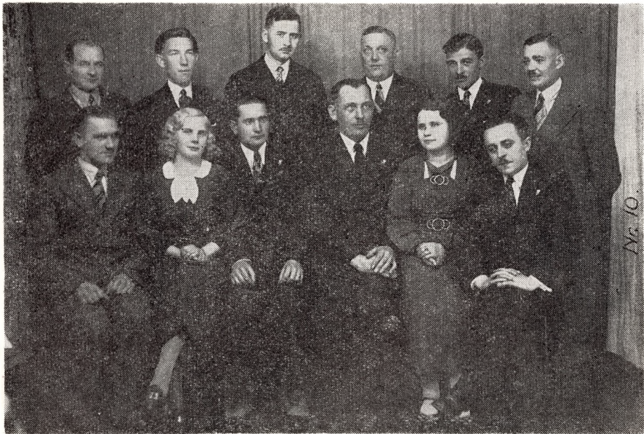
I-szy zarząd Chóru „BARD”