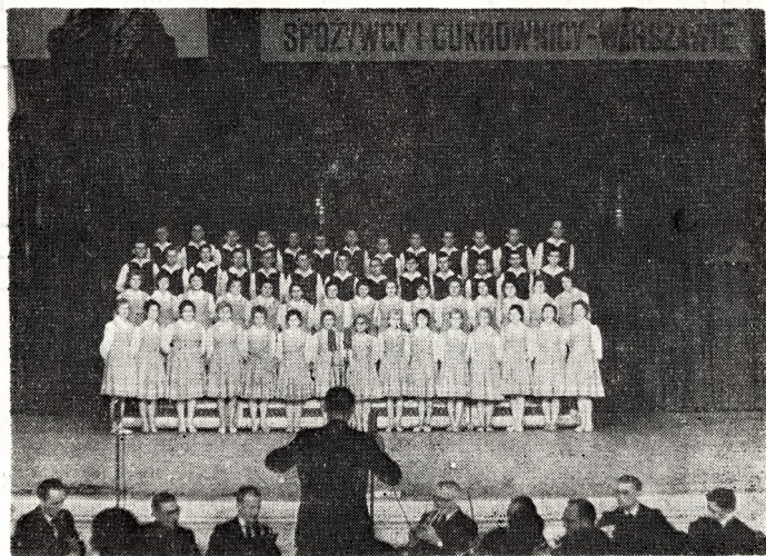
Chór w Pałacu Kultury i Nauki Warszawa 1962 r.

Lata 1967—1969 obfitują raczej w skromniejsze wyczyny naszego zespołu, i kryją w sobie pewien niepokój. Jest to oczywiste że po szeregu latach pełnego dynamicznego rozwoju i niestrudzonej pracy następuje chwila rozprężenia i odpoczynku. Jednak nasze 35-letnie doświadczenie zobowiązuje nas przed społeczeństwem, władzami i samym sobą uczynić wszystko by działalność tego największego w mieście Luboniu ośrodka kulturalnego wykazała tendencje rozwojowe dla dobra społeczeństwa i nas samych.