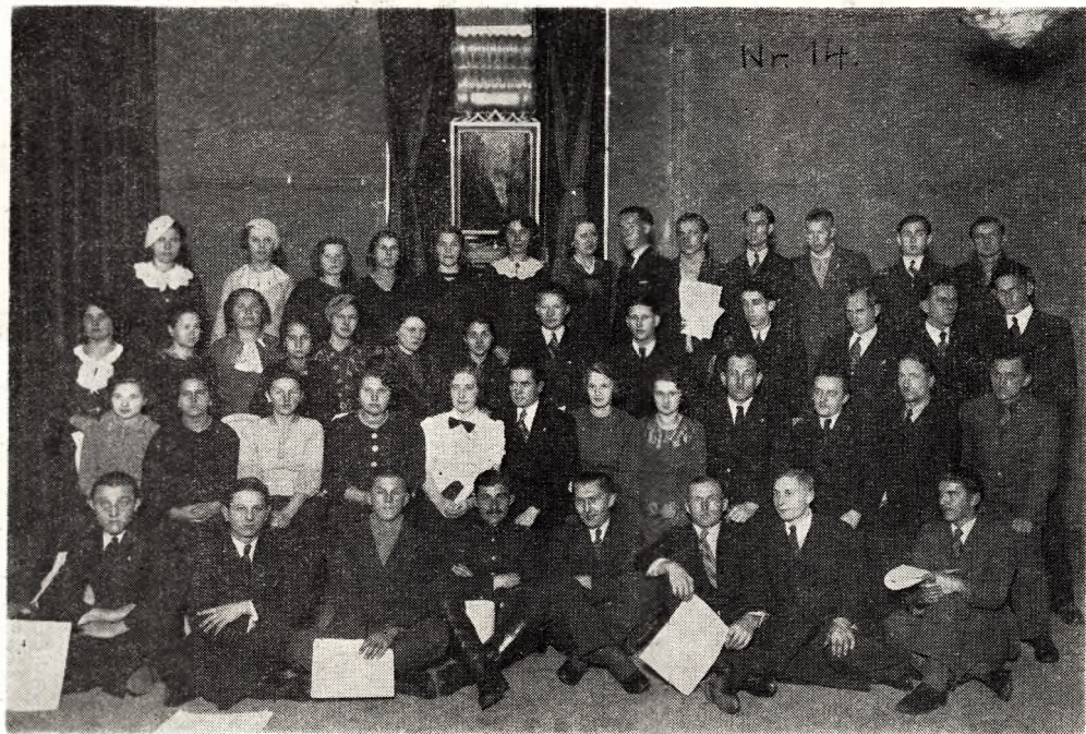
Chór w roku 1936