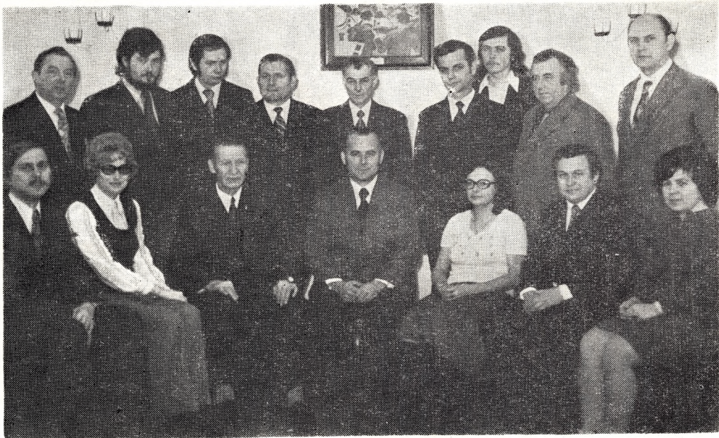
Zarząd w roku Jubileuszowym