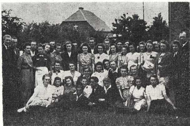
Zjazd Okręgowy Lasek 1946 r.

Rok 1947 upamiętniony jest uroczystością wręczenia nam sztandaru. Od tej chwili przeżywamy prawdziwy „renesans” w naszej pracy. Występujemy niemal we wszystkich Świętach Pieśni. Utrzymujemy również tradycje w wystawianiu DOŻYNEK i łączności z Polskim Radiem.