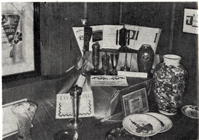
Nagrody i wyróżnienia

wadzić nas w atmosferę spokoju i przesadnego zadowolenia.